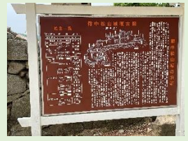
天守が現存する唯一の山城「備中松山城」

岡山県高梁市の最も高い所に天守が現存する山城「備中松山城」の視察は、天守へ登城しながら観光誘客に向けた取組みなどの説明を受けました。この市は、山城と「ジャパンレッド」発祥の地～弁柄と銅の町・備中吹屋～を2大観光地として誘客を図っています。