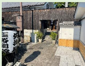
「山陽道やかげ宿」 矢掛屋 温浴別館