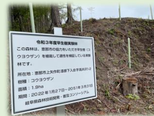
岐阜県の「早生樹」実験林 (高井沢林道沿い)