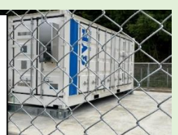
恵那電力の蓄電池

恵那市浄化センター、恵那山ファーム、中央公園、おばあちゃん市、恵那電力、ささゆりの湯などを視察。