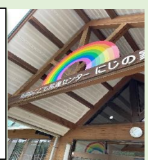
旧吉田小学校を活用した施設

老健ひまわり、いきいき邑、明智駅前プラザ、健康プラザ、にじの家、ふれあいの家などを視察。