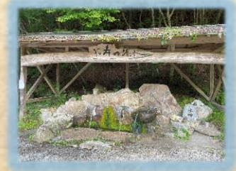
達原地区にある「まろやか天然水・福寿の清水」